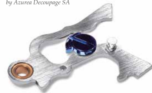
> Actionneur mécanique réalisé par la société Azurea Decoupage SA > Mechanical actuator made by Azurea Decoupage SA

Azurea Group is building on these values by creating an independent entity in 2023, specialising in stamping. Azurea Decoupage has emerged from the historical activity of Azurea Technologie Horlogère SA, relaunched in 2012. Its watchmaking roots have enabled it to build up remarkable expertise in micro-technical machining over more than a century. Ambition, independence, commitment, flexibility, respect and transparency have always guided this group to form the pillars of the future. •