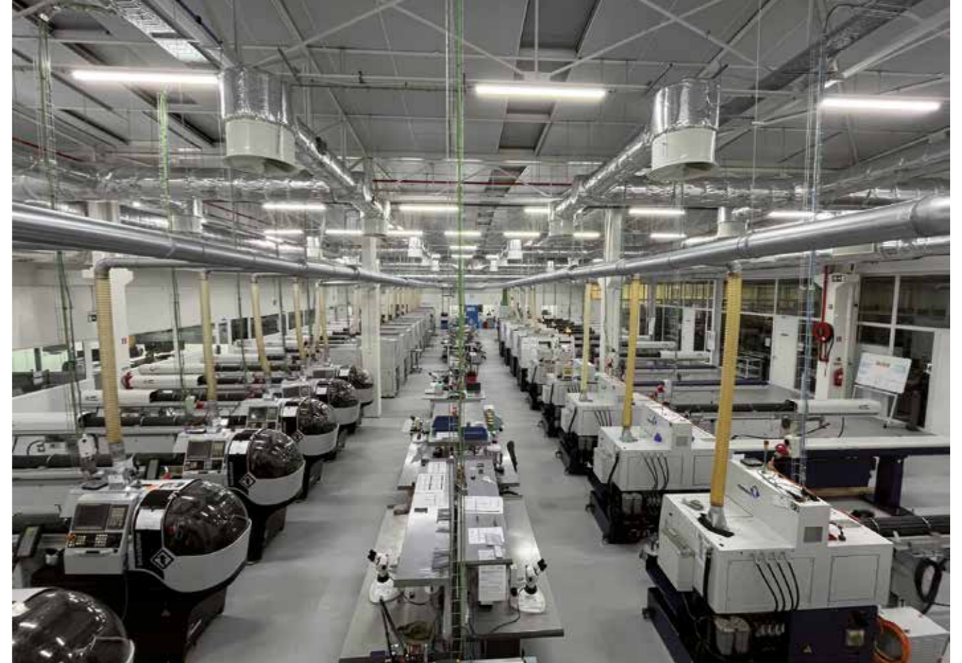
> L'esprit Azurea a toujours œuvré en faveur de la verticalisation des procédés. > Azurea has always been committed to vertical processes.

Azurea's presence across the entire value chain enables it to be flexible and responsive. Its vertical presence is a major advantage in terms of control over its manufacturing processes and its ability to innovate and adapt to changes in the market.